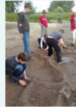
Prille strijd tegen het water herleeft in het spel.

De vertaling van cultuurhistorie - het grote verhaal van de waterlinie - naar eigentijds gebruik kan op ongelooflijk veel manieren.