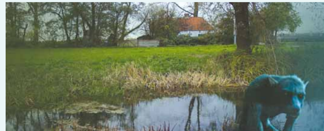
Weerwolfhuisje bij de Rietveldsche Wetering in Culemborg; het is er nog steeds niet pluis.

In het door water gekweld Gelderse gebied drukten moerassen een stempel op de volkscultuur, op dialecten en bijgeloof. De frustraties over de wateroverlast waren een voedingsbodem voor een angst voor heksen en weerwolven. In het Gelderse waterlinielandschap bestaan oude volksverhalen over schimmen die 's nachts met een stalcaars rondlopen op plekken waar woonbuurten zijn vergaan. Andere verhalen reppen over verzwolgen boerderijen die met helder weer zijn te zien in de putdiepe dijkdoorbraakkolken.