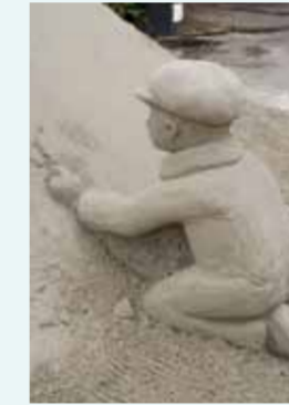
Verbeelding heldendaad van Hansje Brinker.

Ontwikkelingen op het vlak van water, natuur en steden- of dorpsbouw kunnen daarbij de rol van aanjager spelen. Hiernaast en hieronder zijn voorbeelden gegeven van transpositie waarbij speciaal is gelet op begrijpelijke vertaling en op herkenbaarheid van het lied van de waterlinie in een nieuwe toonhoogte.