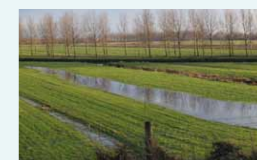
Eeuwenoud cultuurland langs de Diefdijk waar je het zweet rukt van de ontginners.

Zo kreeg een unieke linie gestalte, die vriend en vijand ontzag inboezemde. Misschien hoefde er daarom nooit slag om haar geleverd te worden. Zelfs zijn er aanwijzingen dat de waterlinie Nederland herhaaldelijk heeft behoed voor verlies van zijn zelfstandigheid.