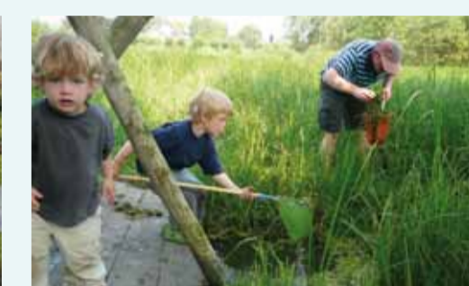
Kinderen ontdekken Moeder Natuur rond een oud boerenslootje in Culemborg.