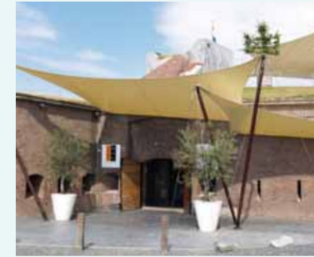
Verdedigingsfort in Lent leeft voort als Wijnfort.